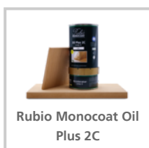
Rubio Monocoat Oil Plus 2C